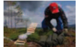
Planting: Fornyingsplikta etter slutthogst må etterlevast, skriver innsenderen.

Dette gjeld serleg skogareal på utanbygds hender, der eigarane knapt kjenner sin eigen skog, og overlet skogsdrifta til skogeigar-