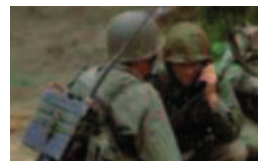
HV: Heimevernets struktur og styrkeoppsettning bør videreføres, skriver innsenderen.

I dagens Europa står en overfor uvante utfordringer på det sikkerhetspolitiske området. Krig og aggresjon kan være så mangt, nettsteder hakkes, økonomisk press, propaganda og bruk av regulære og irregulære styrker. Hybrid krigføring er det vanskelig å forsvare seg mot. Og aggressive og fiendtlige handlinger kan opptre hvor en minst ventet det, egentlig hvor som helst i landet. Vi har mange vitale installasjoner i vårt langstrakte land som i en krisesituasjon bør bevoktes, olje- og gassanlegg, boreplattformer, elektrisitetsverk med tilhørende kraftlinjer bare for å nevne noe. Og en kan ikke basere seg på at en har tid til å sette inn styrker fra andre steder i landet, spesielt hvis noe skjer samtidig flere steder. Heimevernets