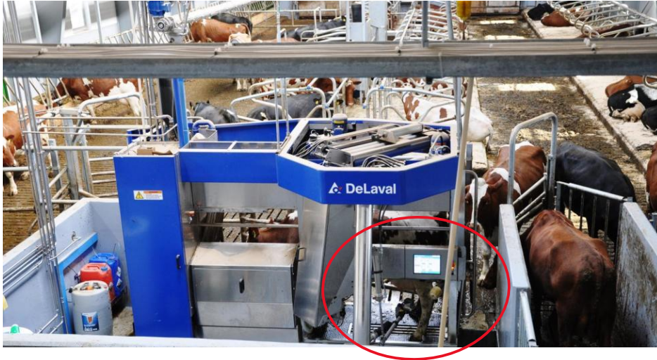
Bilde 6 - Overblikk av rom som bonden kan operere fra med skjerm, plassering i fjøs med ku i melkekø, DeLaval

På bilde 6, ser vi at melkeroboten i sitt fysiske script, skiller mellom en ku-side og en menneskeside. Kun et område ved juret er delt i «fellesareal» (sirklet inn på bilde). Robotene har på den ene siden et rom/luke der bonden kan operere fra. Når melkingen er ferdig åpnes porten foran henne og hun kan gå ut av roboten. Roboten produserer detaljerte data av selve prosessen. Eksempler på data kan være celletall og farge på melk, hurtigheten av tømning av hver spene og kraftfôrrasjon per ku. Alt dette og mer til kan bonden undersøke på dataen eller overvåke via smartmobil. Roboten kommer også med softwareprogrammer som for eksempel kan teste kraftfôrmengde mot melkeytelse i forhold til kuas laktasjonskurve. Strategi og mål er her å spare mest mulig kraftfôr og fortsatt få ut mest mulig melk. Programmet kan deles med andre utenfor gården, som for eksempel rådgivere i Tine. Tine har spesialiserte rådgivere både for DeLaval og Lely. Fra sitt kontor kan rådgiverne gjøre endringer på den fysiske melkeroboten og tilpasse nettopp kraftfôrmengden.