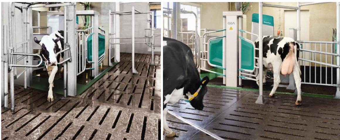
Bilde 1 – Ku kommer ferdigmelket ut, GEA

Roboten er en standardisert boks som kua kan gå inn i via en port som åpnes og lukkes automatisk (bilde 1 og bilde 2). Boksen er avsperrert og utgjør et enkeltrom for kua. Når kua er på plass lukkes den åpne porten for å beskytte melkeprosessen fra å bli avbrutt av andre kyr. For eksempel har Lely jernstenger og jernstengporter, mens vi på bilde 1 og 2, ser to større porter og sokkel i midten. Rommet er også smalt nok til at kua blir styrt og plassert riktig i forhold til jur og området robotarmen opererer fra. Deksler beskytter igjen teknologien og gir et helhetlig inntrykk. Dekslene beskytter også bonde og ku mot eventuelle ulykker i forbindelse med for eksempel støt og klemming av mekaniske og elektriske deler. Robotens script kombinerer med andre ord disiplin og omsorg ved at den på den ene siden styrer kua i riktig retning, samtidig som den beskytter den fra å skade seg selv. Slik sett fremgår det av robotens oppbygning at kua er verdifull, men ikke nødvendigvis vet sitt eget beste.