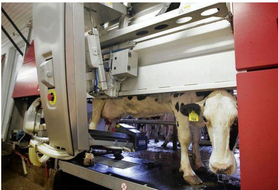
Bilde 4 - Robotarm, Lely

Det er ønsket om kraftfôr og opplevd behov for å bli melket som skal lokke kua inn i melkeroboten. Dersom kua har fått dagsrasjonen sin får den ikke mer. Den får heller ikke kraftfôr dersom den ikke har melketillatelse. Kua vil bli avvist hvis den kommer for tidlig tilbake til melking da det er minimumsintervall mellom hver melking. De ulike robotene kommer med ulikt «tilbehør» som kan kjøpes til, som for eksempel en vekt som veier kua. Når kua er på plass lokaliseres spenene av et kamera og en robotarm kommer inn fra siden og beveger seg under kua (bilde 4).