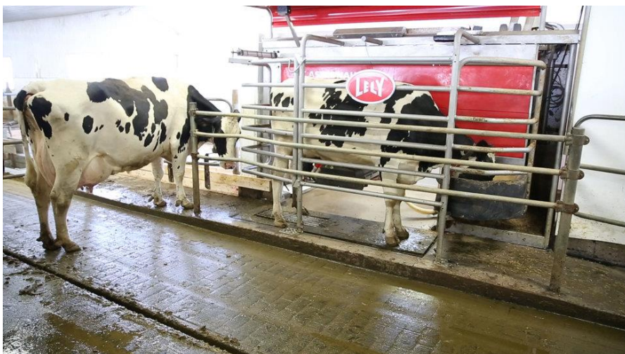
Bilde 3 - Ku spiser fra kraftfôrstasjon i melkerobot, Lely

Det er ønsket om kraftfôr og opplevd behov for å bli melket som skal lokke kua inn i melkeroboten. Dersom kua har fått dagsrasjonen sin får den ikke mer. Den får heller ikke kraftfôr dersom den ikke har melketillatelse. Kua vil bli avvist hvis den kommer for tidlig tilbake til melking da det er minimumsintervall mellom hver melking. De ulike robotene kommer med ulikt «tilbehør» som kan kjøpes til, som for eksempel en vekt som veier kua. Når kua er på plass lokaliseres spenene av et kamera og en robotarm kommer inn fra siden og beveger seg under kua (bilde 4).