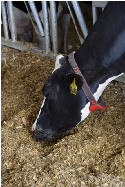
Bilde 5 - Kuhalsband, Lely

skal hjelpe spenene med å tette seg litt igjen slik at uhumskheter ikke skal finne veien opp i juret og lage jurbetennelse. Kyrne har en datasensor på et halsband eller fotband som kommuniserer med en datamaskin. Ved ID nummerering får kyrne en digital identitet. Individuell loggføring registrerer når de melker seg, hvor mye melk som kommer fra hver spene og hvor lang tid det tar. Det blir også loggført hvor mye kraftfôr de har fått og hvor aktive de er. Aktiviteten brukes til for eksempel til å forutsi brunst, dvs. dersom kua er mer aktiv enn vanlig kan dette skyldes at hun er klar for å bli inseminert og få ny kalv (bilde 5).