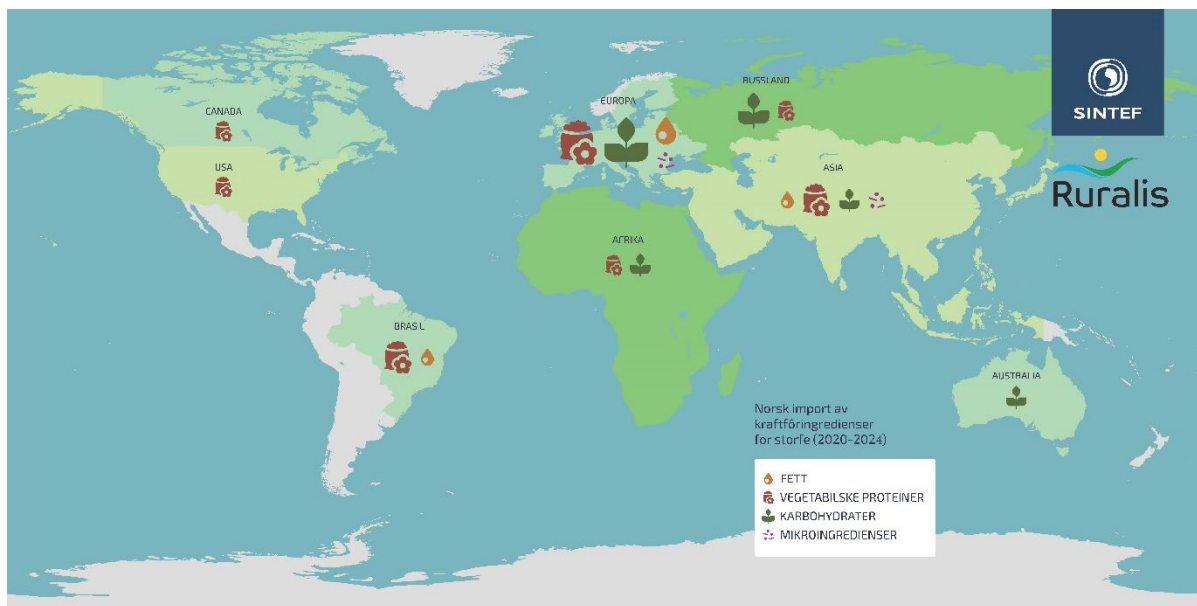
Figur 3: Kart over opprinnelsen av ulike kraftfôringredienser importert til produksjon av storfe i Norge (2020-2024)

Kilde: Landbruksdirektoratet, SSB, Ruralis